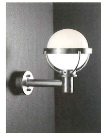
Design SEL Plast A/S

Farve/Overflade: Armaturstel: hvid pulverlakering eller forzinket.